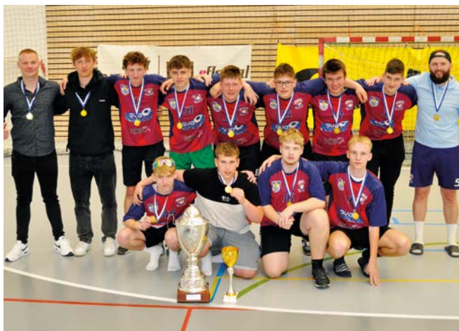
1. místo Orel Bořitov-Relax Rájec Jestřebí

Ročník 2024/25 mají za sebou také junioři. Poslední turnaj sehráli 10. 5. 2025 v Kuřimi (pořadatel Orel Brno-Řečkovice). Díky lepším vzájemným zápasům s Řečkovici získali mistrovský titul junioři Orla Bořitov - Relax Rájec Jestřebí (24 bodů). K prvnímu místu jim stačila v posledním zápase výhra nad Dolními Bojanovicemi 7:1. Druhé místo se stejným bodovým ziskem připadlo Orlu Brno-Řečkovice (vzájemné zápasy s Jestřebím 4:3, 1:4). Stříbrné medaile potvrdili řečkovičtí důležitou výhrou nad Novým Městem 3:1. Bronzové medaile si na krk pověsili junioři Orla Nové Město na Moravě (18 bodů). Čtvrté místo Orel Vyškov (11 bodů), páté