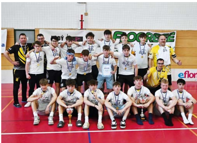
1. místo Orel Brno-Řečkovice

Orel Brno-Řečkovice se po roce opět raduje z mistrovského titulu v kategorii dorostenců. Zvládl hned svůj první důležitý zápas na turnaji, když po nájezdech porazil ŠSK Očov Hodonín 3:2. Jelikož zvládl vyhrát i ostatní zápasy, po zásluze si dorostenci mohli pověsit na krk zlaté medaile. ŠSK Očov Hodonín taktéž vyhrál 4 zápasy, ale touto jedinou ztrátou byl odsouzen k druhému místu . Bronz bral domácí Orel Uherský Brod , když získal 6 bodů a v důležitém zápase porazili rivala z Orla Nivnice 4:2. Právě horší vzájemný zápas s Brodem znamenal pro Orel Nivnici čtvrté místo (6 bodů), pátý skončil Pitbulls Ivančice se třemi body, šestý TJ Sokol Střelice také tři body, ale horší vzájemný zápas s Ivančicemi.