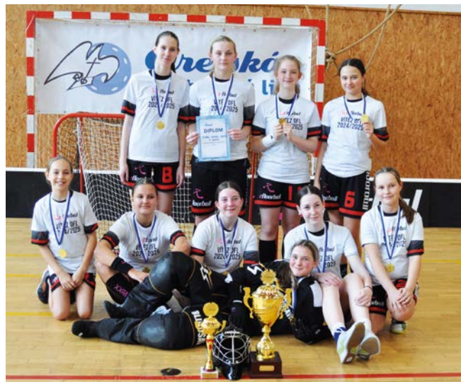
1. místo Florbal Slavičín

Po více než 10 letech se povedla otevřít kategorie žákyň. Čtyři družstva (Florbal Snipers Slavičín, Orel Uherský Brod, Bomar Modřice, Orel Těšany) během ročníku odehrála čtyři turna-