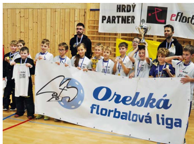
1. místo FBO Orel Boskovice

když si jako jediní dokázali poradit s Boskovicemi. Bronz stejně jako loni putoval do Orla Uherský Brod (9 bodů). V důležitém zápase přetlačili Šlapanice 3:2 po samostatných nájezdech. I tento výsledek bohužel pro Šlapanice znamenal opakování loňského scénáře. Razítko na to dala překvapivá výhra Sívce nad