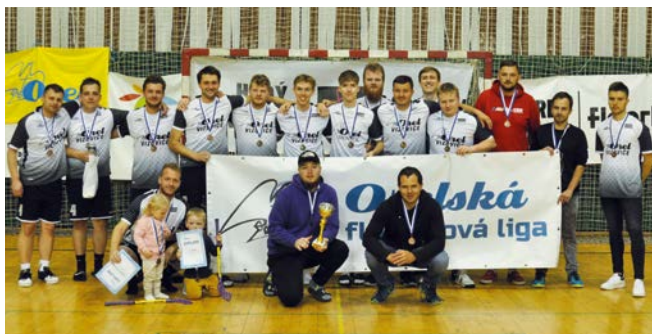
3. místo Orel Vizovice

se z postupu do boje o titul, Vizovice si zopakovaly boj o bronz z loňské sezony.