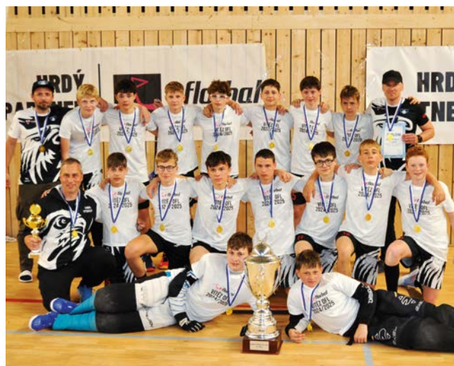
1. místo Orel Vyškov