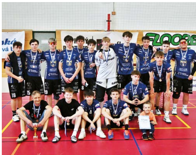
3. místo Orel Uherský Brod