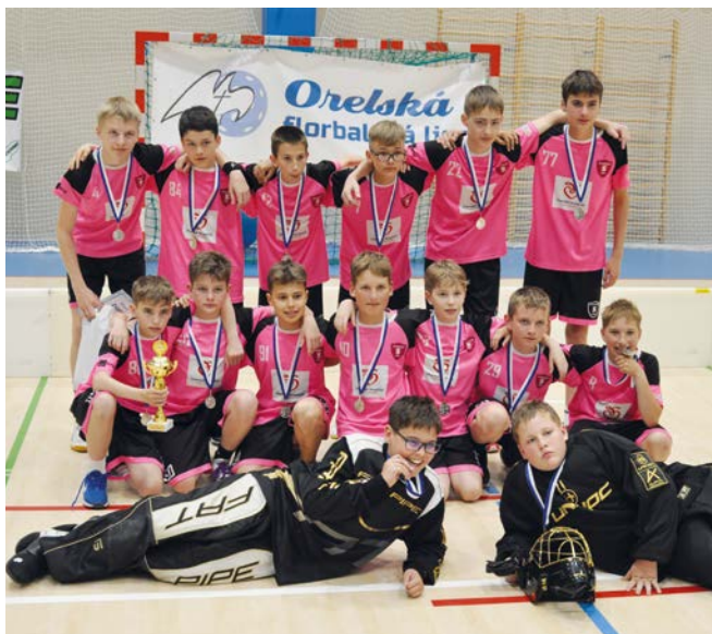
2. místo FBC Slovácko