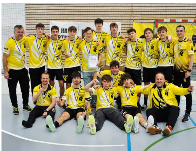
2. místo Orel Brno-Řečkovice