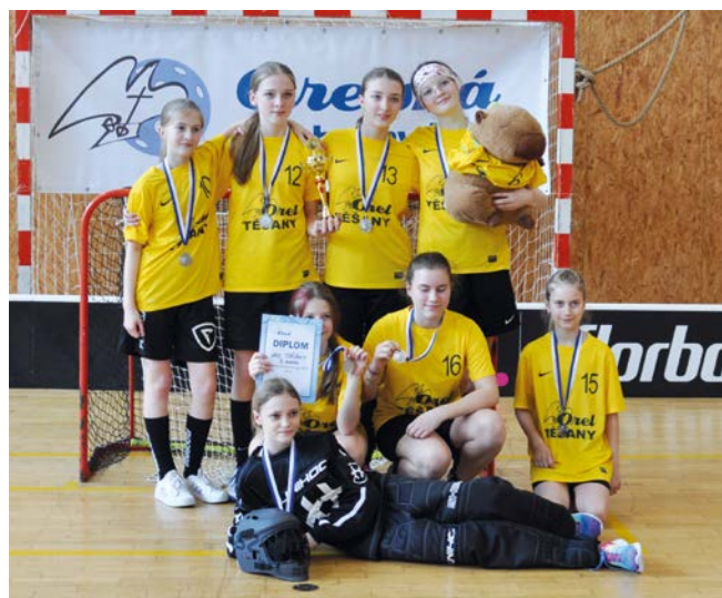
2. místo Orel Těšany