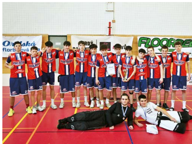
2. místo ŠSK Očov Hodonín