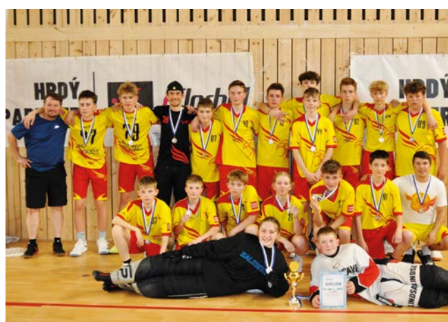
2. místo Orel Nové Město na Moravě