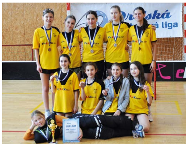
3. místo BOMAR Modřice