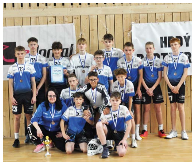
3. místo Orel Uherský Brod

Jako první si semifinále zařídili z Nového Města, když porazili 6:1 Orel Bořitov. Druhé čtvrtfinále bylo již vyrovnanější. Uherský Brod hrál po řádné hrací době 1:1 s Řečkovicemi. Prodloužení tentokrát Uherskému Brodu přálo a zlatý gól poslal Brod do bojů o medaile, naopak zklamané Řečkovice se s turnajem loučily. Vítěz skupiny A z Devíti Křížů se dlouho trápil proti