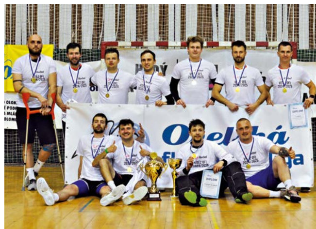
1. místo FBO Orel Boskovice

První čtvrtfinále mezi Boskovicemi a Blanskem dopadlo lépe pro Boskovice, které po výsledku 6:3 postoupili do semifinále. V dalším zápase domácí Saros díky skvělé třetí třetině porazil Orel Hranice 10:4. Žádné drama nepřipustil ani Orel Kunštát, když si zastřílel proti Panthers Olomouc a vyhrál 17:2. V posledním čtvrtfinále si Orel Vizovice poradil 7:3 s Orly z Dolních Bojanovic. První semifinále Boskovic se Sarosem nabídlo vyrovnanou partii. Základní hrací doba nestačila k určení postupujícího, už to vypadalo i na nájezdy, ale Boskovice tři sekundy před koncem rozhodly o postupu do finále. Druhé semifinále a druhý vyrovnaný zápas. Orel Kunštát přetlačil Orel Vizovice 5:4 a radoval