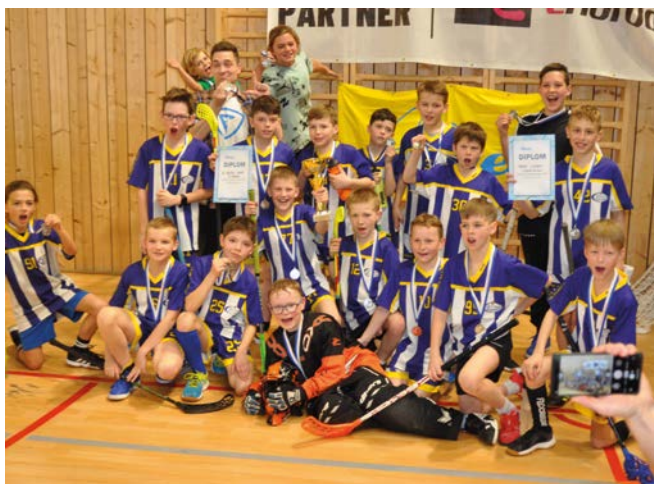
2. místo SK Sivice