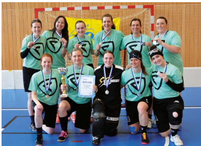
2. místo Aligators