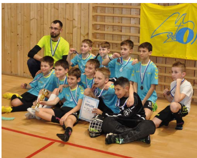
3. místo Orel Uherský Brod

Boskovicemi a Orel Eagles Šlapanice se propadl z bronzu na čtvrtou pozici. Páté místo patřilo Orlu Vyškov , šesté Florbalu Snipers Slavičín .