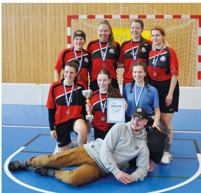
3. místo FBC Slavkov