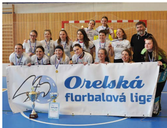
1. místo TJ Sokol Třebíč