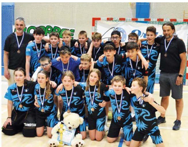
3. místo Orel Vyškov