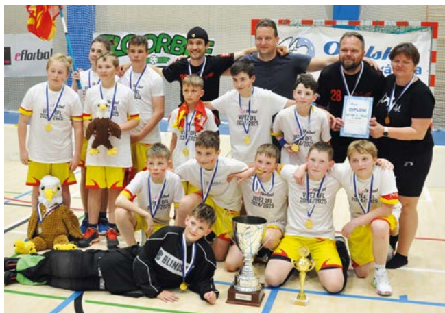
1. místo Orel Nové Město na Moravě