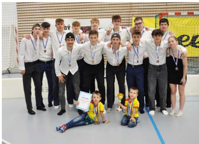
3. místo Orel Nové Město na Moravě